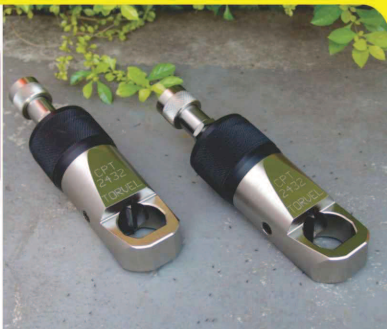
Cortadores de porcas hidráulicos