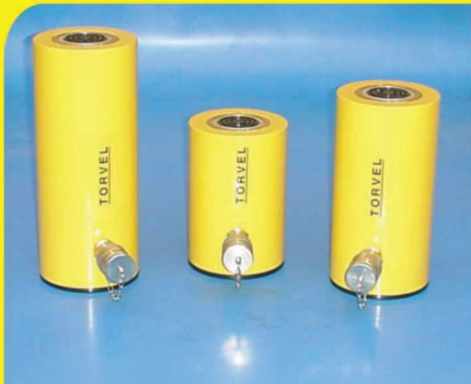
Da esquerda para a direita: TRCA-506, TRCA-502 e TRCA-504