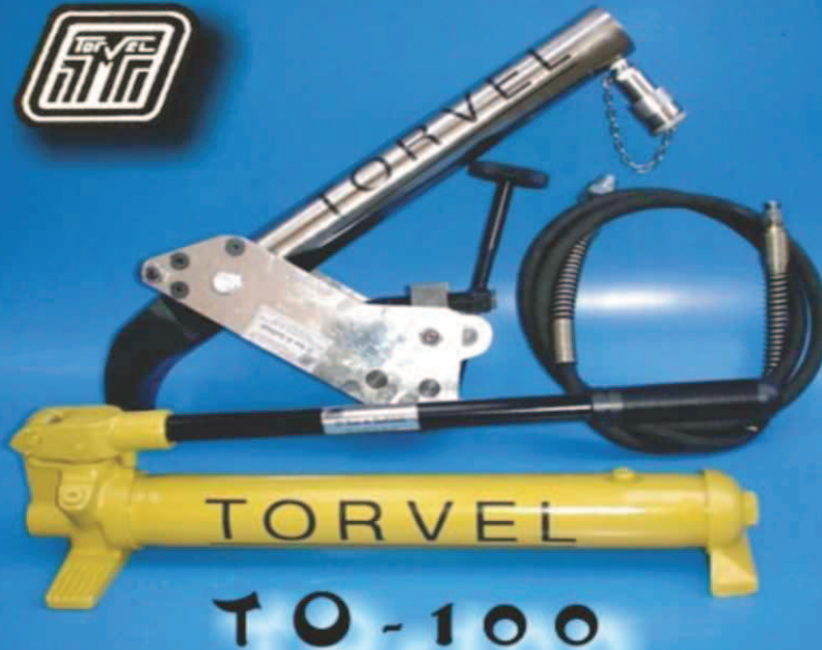
Conjunto completo TO-100