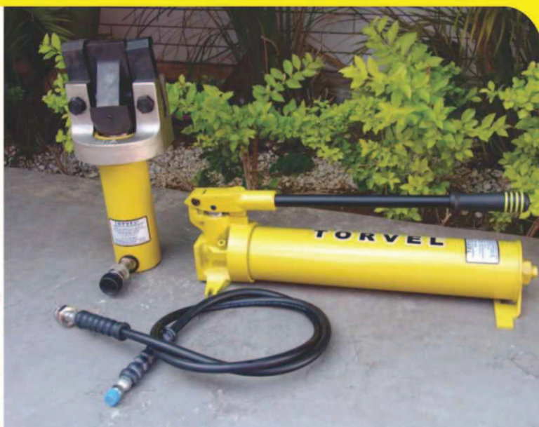
Conjunto completo TO-2000

Conjunto portátil para destalonar pneus fora-de-estrada, com capacidade para 25 Ton. Ferramenta utilizada em pneus de grande porte, em grandes caminhão e escavadeiras com aros entre 49 e 67"